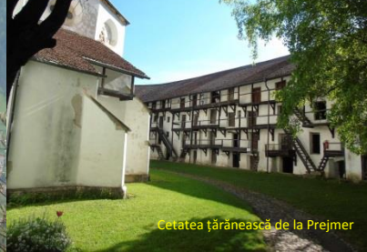
Cetatea țărănească de la Prejmer