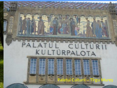
Palatul Culturii – Tîrgu Mureș