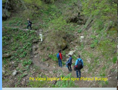
Pe Valea Jepilor - Mări spre Platoul Bucegi