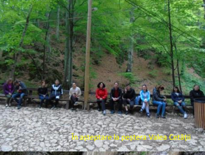
Pe șoseaua la poșterea Valea Cetății