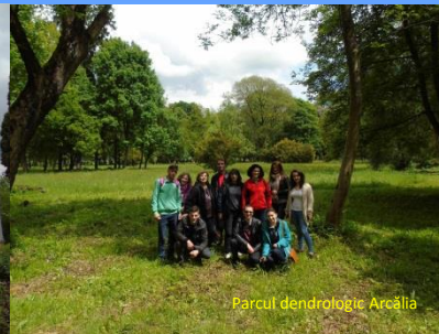
Parcul dendrologic Arcălia