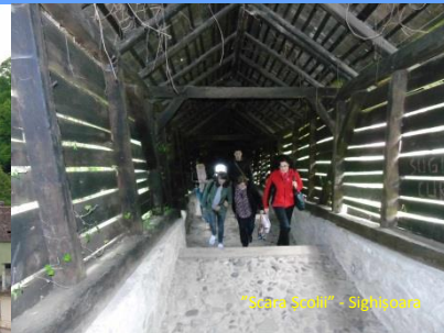
"Șirna Șoșii" - Sighișoara