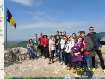
Cetatea Cetății Râșnov