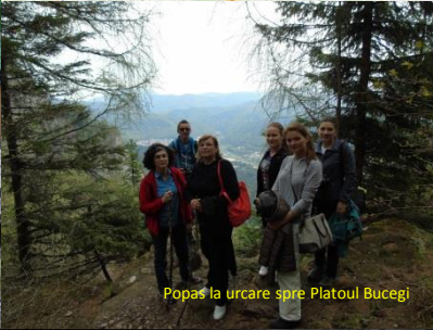
Popas la urcare spre Platoul Bucegi