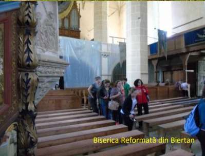
Biserica Reformată din Biertan