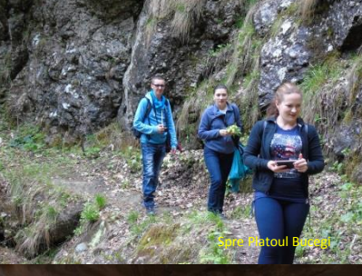
Spre Cetoul Băieșii