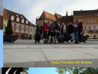
Piața Primăriei din Brașov