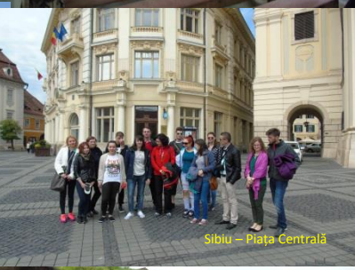
Sibiu – Piața Centrală