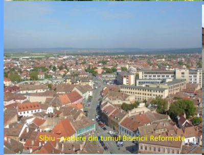
Sibiu – Așterea din turnul Bisericii Reformate