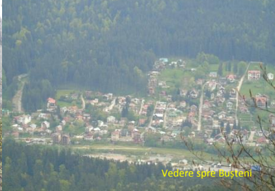
Vedere spre Bușteni