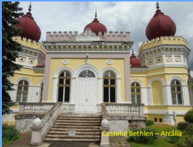
Castelul Bethlen – Arcălia