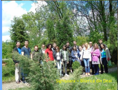
Sighișoara – Biserica din Deal