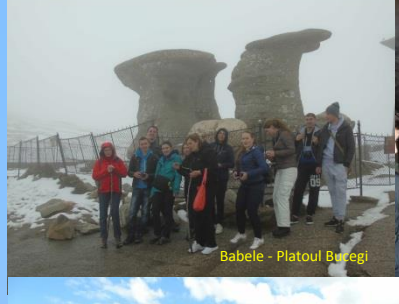
Babele - Platoul Bucegi