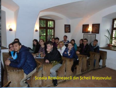
Școala Românească din Șcheii Brașovului