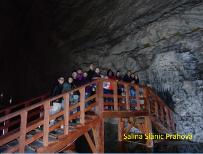
Salina Slănic Prahova