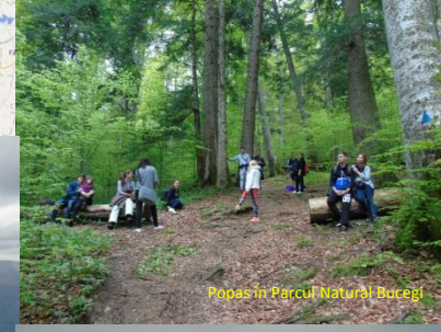
Popas în Parcul Natural Bucegi