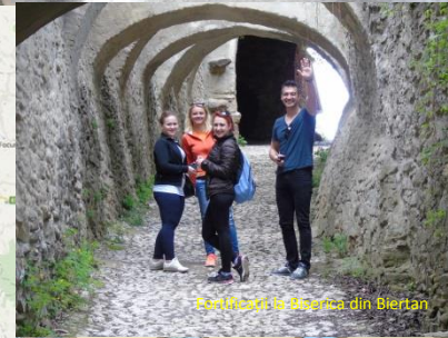
"Șirna Șoșii" la Biserica din Biertan