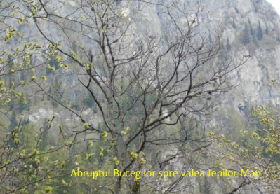
Abruptul Bucegilor spre valea Jepilor Mări