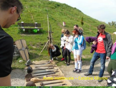
Așterea din turnul Bisericii Reformate - Cișnădie Râșnov