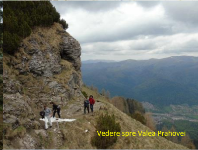
Vedere spre Valea Prahovei