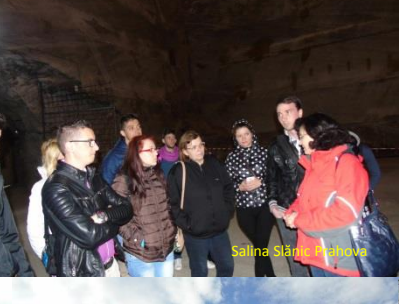
Salina Slănic Prahova