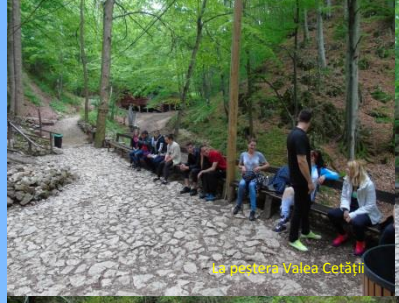
La poșterea Valea Cetății