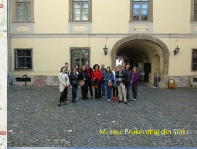
Muzeul Brukenthal din Sibiu